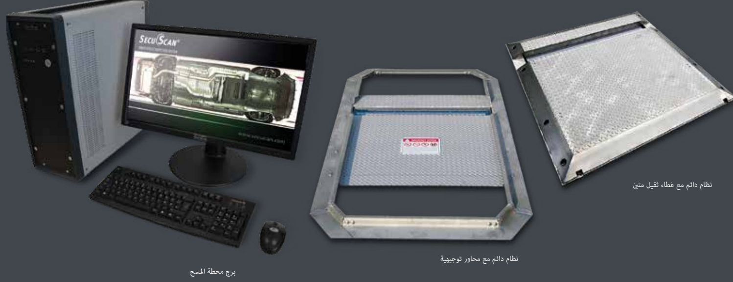
نظام دائم مع غطاء قابل متين