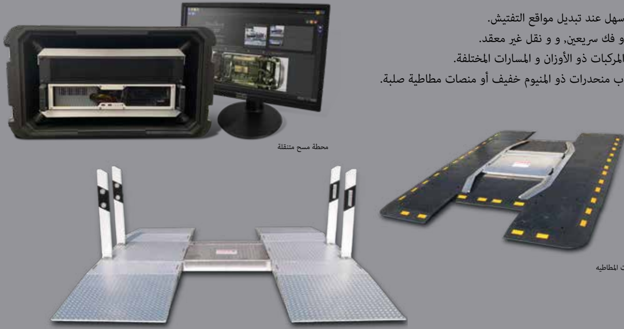
محطة مسح متنقلة